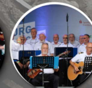
Shanty Chor Duisburg 15:30 Uhr