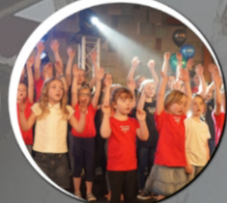
mini musical kids 13:00 Uhr