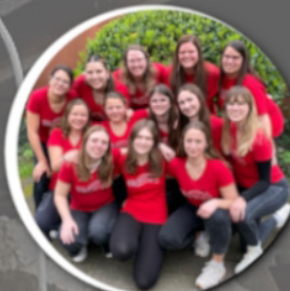
The Voices - Duisburg 14:00 Uhr