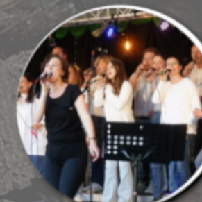
Christians At Work 16:30 Uhr