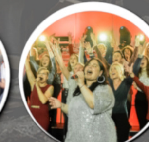
musical kids Rheinhausen 17:15 Uhr