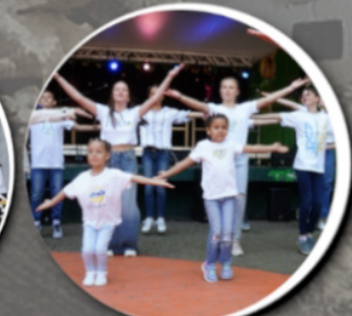
Ukrainische Frauen Union 16:00 Uhr