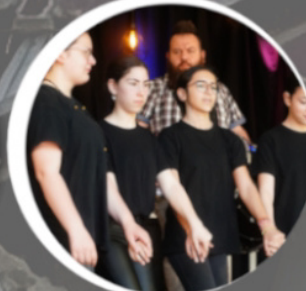
Parcharomana 12:50 / 13:40 Uhr