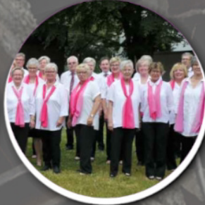
Männer- und Frauenchor Rumeln, 12:15 Uhr