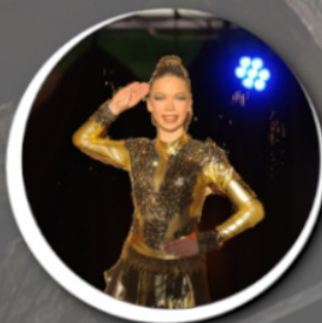
Solomariechen Pia 12:00 Uhr