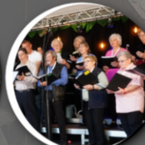
VolksChor Moers 15:00 Uhr